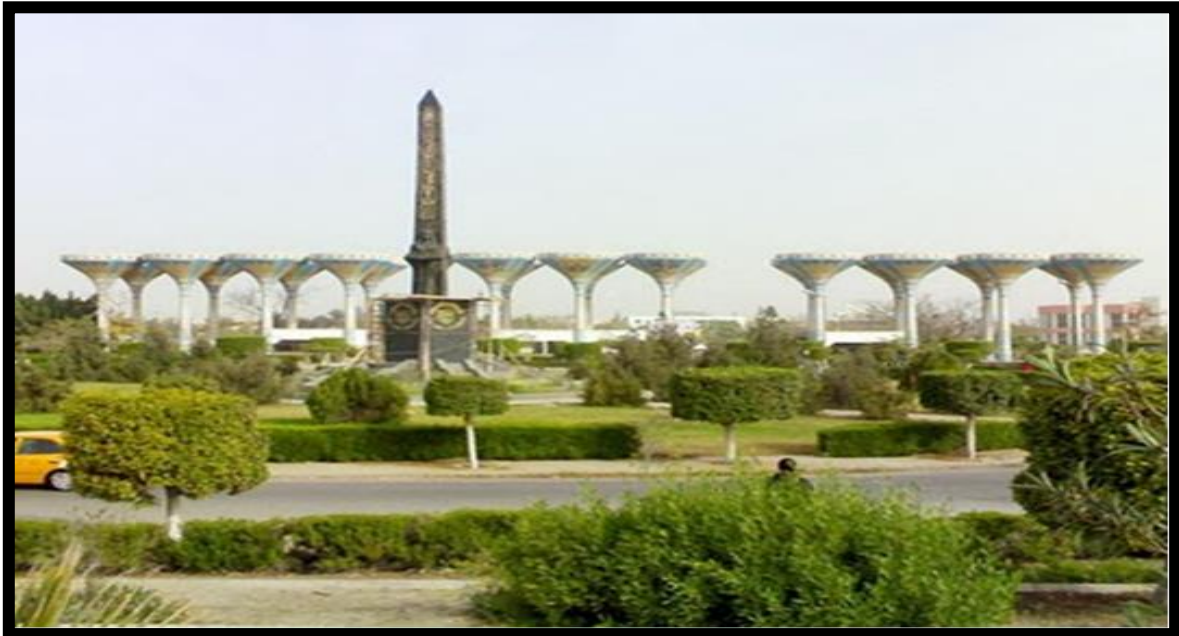
مدخل جامعة قناة السويس بالإسماعيلية