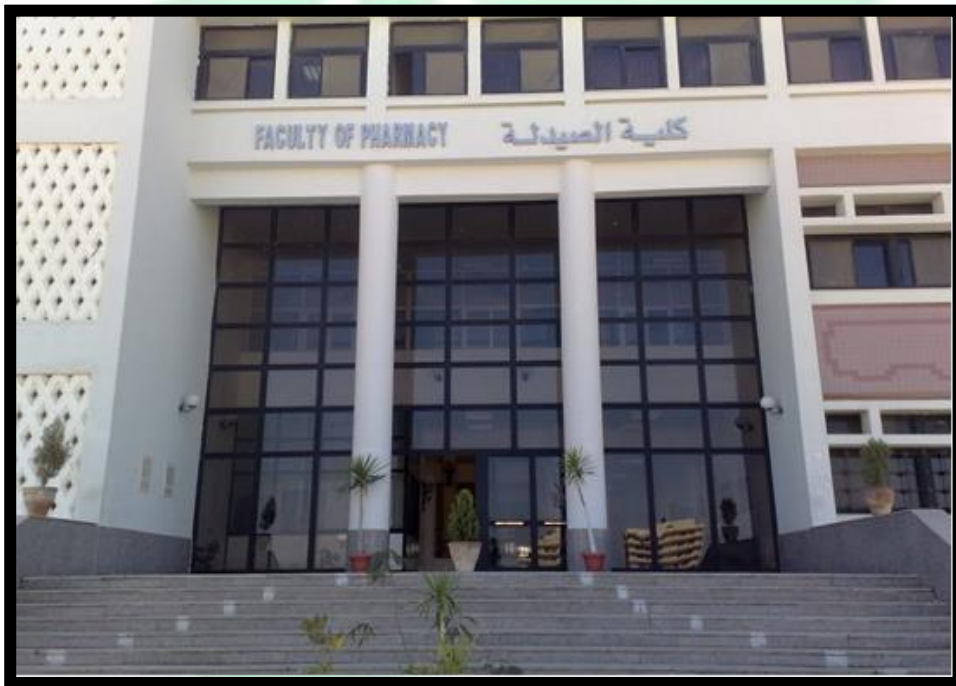
مبنى كلية الصيدلة

دليل الإرشاد الأكاديمي (صيدلة قناة السويس)