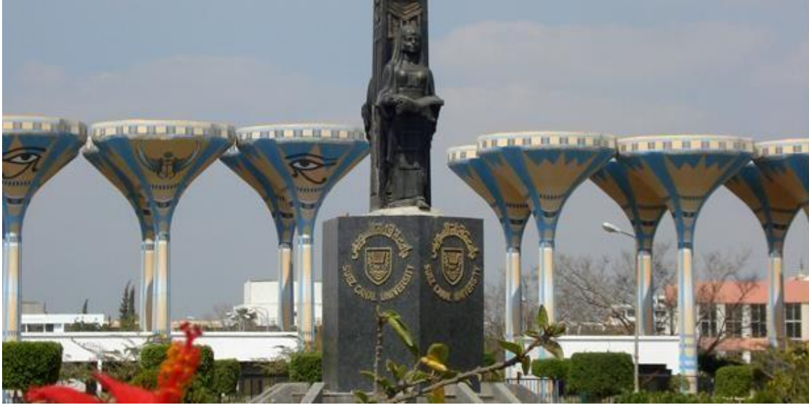
جامعة قناة السويس

جامعة قناة السويس هي جامعة حكومية مصرية ، حيث كان الرئيس محمد أنور السادات "رحمه الله" أول من وضع حجر الأساس لجامعة قناة السويس في 4 أكتوبر 1975 تم إنشاء الجامعة على مساحة 1300 فدان وذلك حسب المرسوم رقم 93 صادرة عام 1976 برئاسة أ.د/عبد المجيد عثمان محمد منذ افتتاح جامعة قناة السويس احتلت مكانة خاصة حيث بدأت بثلاث كليات (كلية تكنولوجيا الهندسة ، كلية التجارة والعلوم الإدارية ، كلية البترول والتعدين) ثم بدأت في إطلاق عدد متنوع من المراكز البحثية المتخصصة والوحدات الخاصة التي تخدم المنطقة بدأت الجامعة عامها الدراسي الأول عام 1977، وتعتبر أول جامعة موجهة لخدمة منطقة مصرية مهمة "الإسماعيلية" التي كانت أرض القتال.