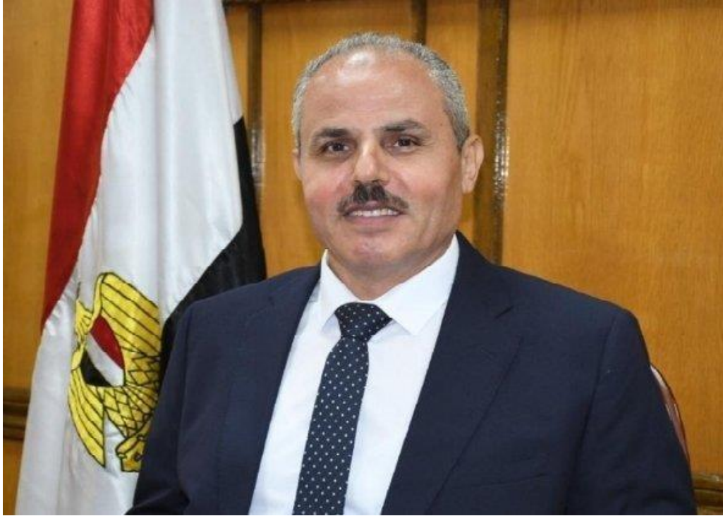
أ.د/ ناصر سعيد مندور رئيس جامعة قناة السويس